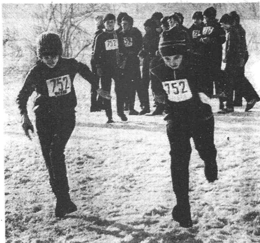
11 марта в Москве проходила городская военно-спортивная эстафета участников игры «Зарница». Эстафета называлась «Будь готов к защите Родины!». 25 команд из различных районов Москвы состязались в умении стрелять, бегать, бросать гранату, подносить боеприпасы, ориентироваться на местности. Лучший результат — 9 минут 37 секунд — показала команда Бабушкинского района.